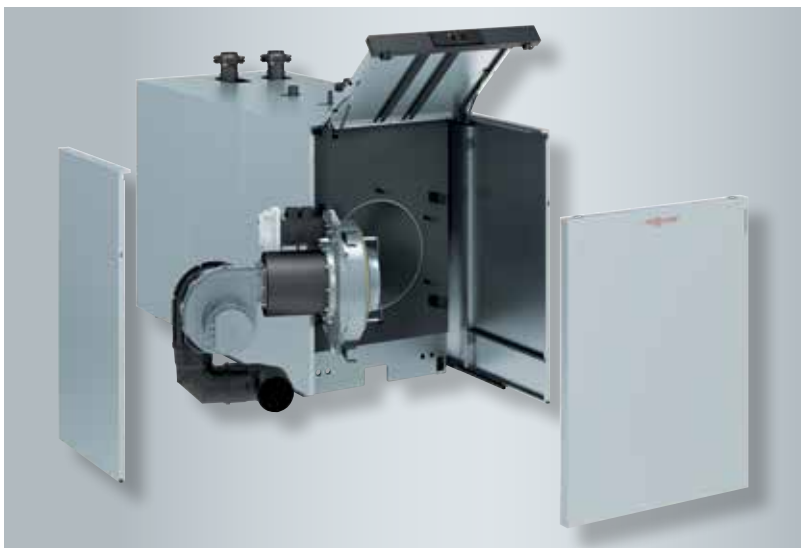
Groot service- en onderhoudsgemak dankzij uitneembare zijpanelen en opklapbare ketelafdekking

De zijpanelen kunnen snel en eenvoudig verwijderd worden, waardoor de MatriX-diskbrander probleemloos bereikbaar is en makkelijk zijdelings naar buiten kan draaien.