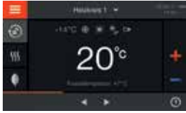
Vitotronic 200 - intuïtieve bediening via groot kleurentouchscreen