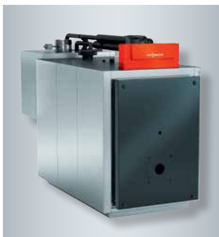
Vitoradial 300-T, 425 en 545 kW