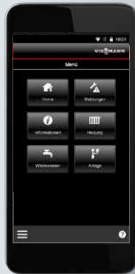
Praktische weergave op smart- phone (iOS en Android)