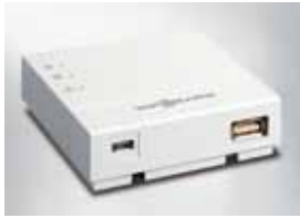
Vitoconnect 100 met aansluitingen voor de stekkeradapter (links) en voor de dataverbinding

De ViCare-app biedt nieuwe mogelijkheden voor de online-regeling van uw verwarming. Via het bewust eenvoudig gehouden grafisch paneel van de ViCare kan uw verwarming volledig intuïtief bediend worden.