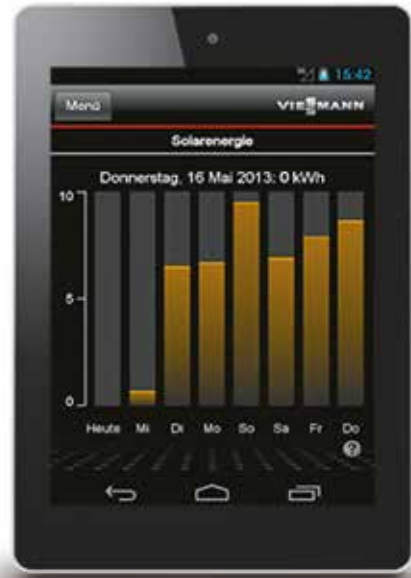
In combinatie met een zonnepaneel wordt de dagelijkse opbrengst weergegeven (weergave op tablet).