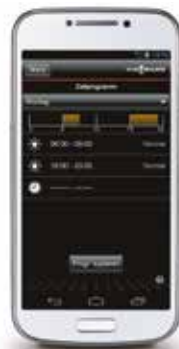
Programmering en weergaven van in- en uitschakeltijden (weergave bij Android)