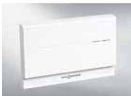
Communicatiemodule Vitocom 100 (type LAN1)

De gewenste watertemperatuur bv. kan via een eigen menu ingesteld worden. Ook het in- en uitschakelen van de sanitair waterverwarming en de circulatiepomp kan ingesteld worden.