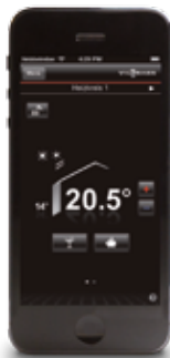
Startscherm voor onmiddellijke selectie van de gewenste kamertemperatuur (weergave bij iOS).